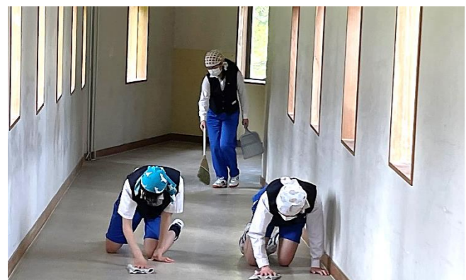
無言・気づき・時間いっぱい 膝をついて隙間なく雑巾をかける