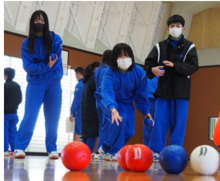
<チームの仲間が見守る中、狙いを定めて渾身の一投>