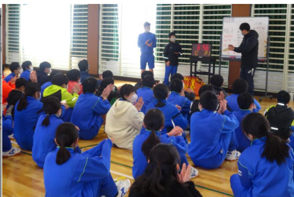
<審判をはじめ、クラスマッチの運営全体をみんなで協力>