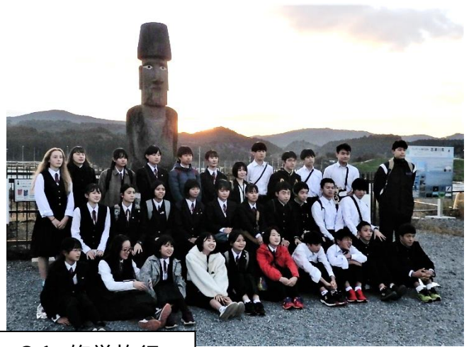
3学年 10/24～26 修学旅行